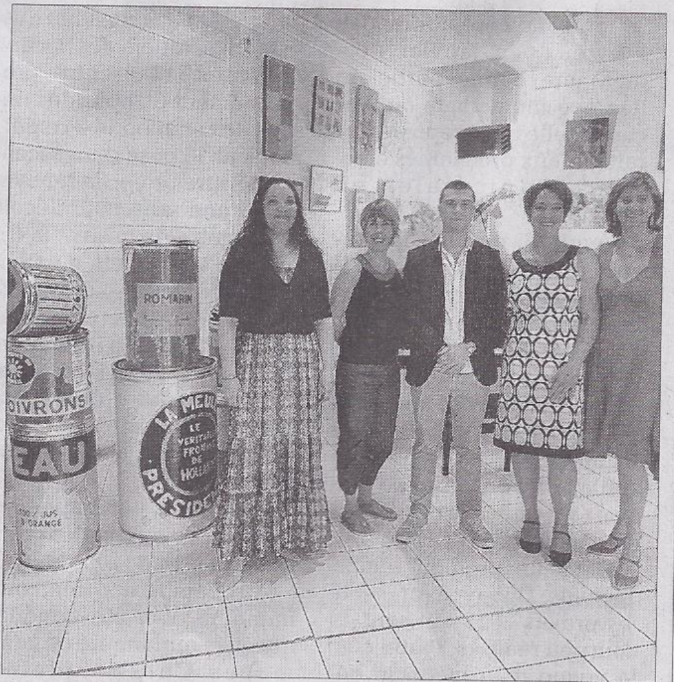
Bidons, tableaux et pianos par trois Malissardoises

Une agréable réception qui réunit l'art et la musique dans ce lieu prédestiné à recevoir de nouvelles expositions, avec, au beau milieu d'un grand choix de pianos, un majestueux Steinway et Sons piano à queue de concert. Les œuvres de ces trois artistes Malissardoises sont visibles jusqu'au 5 juillet. □