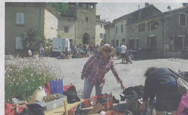
La foire aux greniers a pris vie au cœur du village, sous un soleil magnifique.

Dimanche matin, ce sont 70 exposants qui sont venus déballer mille objets des plus courants aux plus insolites, des plus récents aux plus anciens. Impossible de compter le nombre de visiteurs qui viennent chiner la bonne affaire, des petits prix pour la plupart qui font le bonheur des collectionneurs certes, mais aussi de ceux qui ont le coup de foudre pour un objet, un vêtement etc.