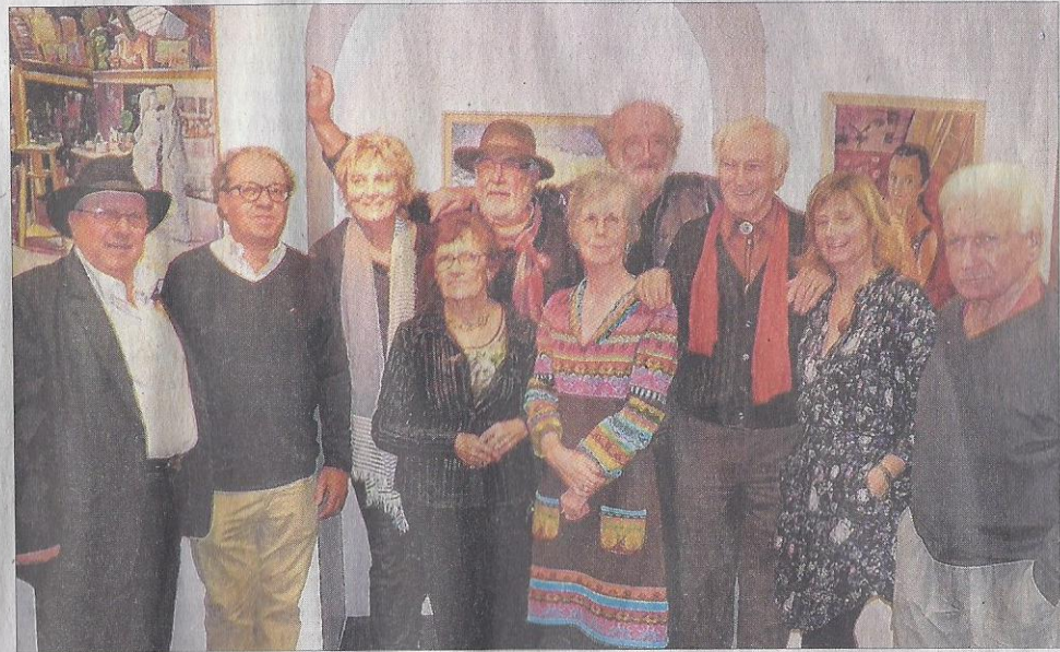
Quelques artistes du Groupe des neuf réunis ici pour une nouvelle exposition.