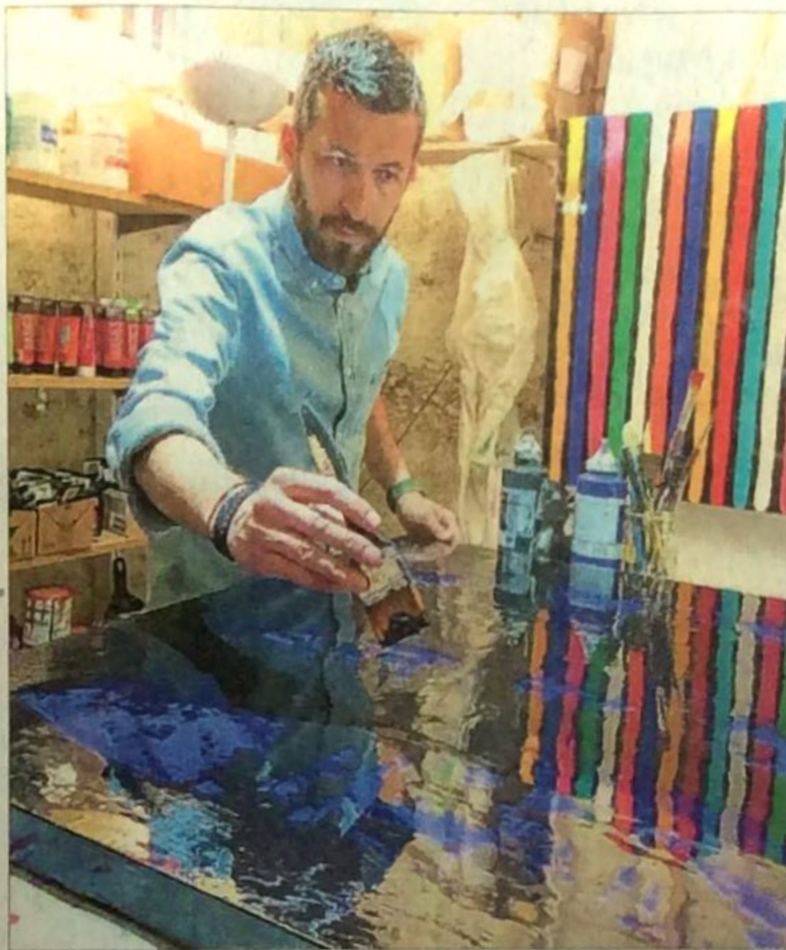
Dans ses séries "Pop-aborigène", "Inside" ou "Brain", Brice Mounier fait émerger les couleurs en travaillant l'acrylique et les pigments de couleur, recouverts d'un vernis de résine ou de polyuréthane.