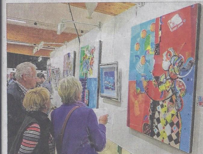
Les tableaux de l'Israélien Yoël Benharrouche et de l'Américain Charles Fazzino ont été appréciés par les visiteurs.