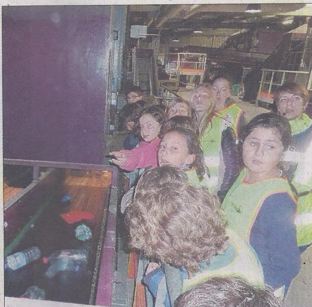
Les élèves ont découvert les machines de tri.

visite. Les élèves ont reçu un stylo fabriqué à partir de plastiques recy- clés et un dépliant à desti- ner à leurs familles. □