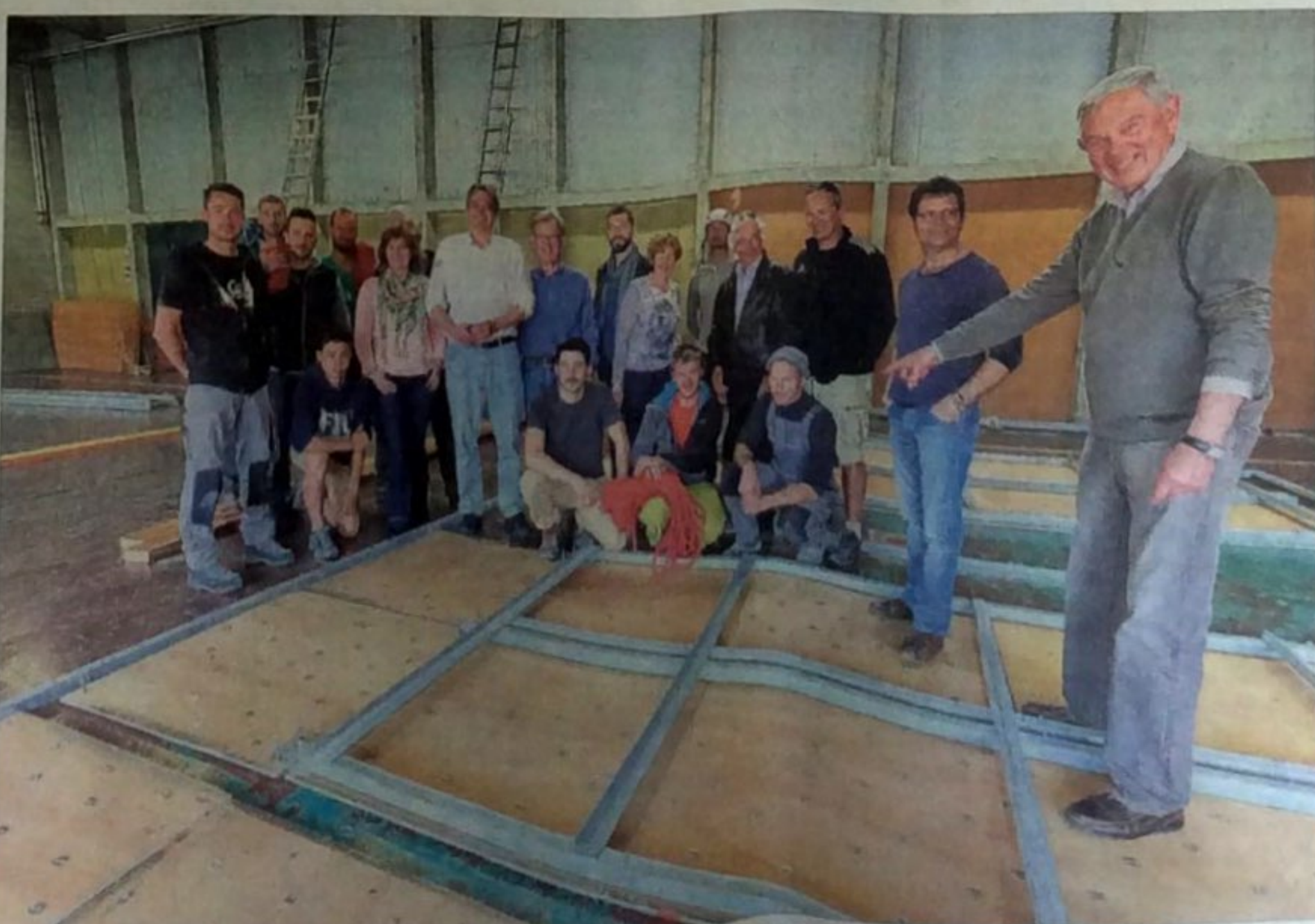
Le chantier du mur d'escalade avance. Ces jours-ci, les membres du Lions-club, les responsables de la fondation Ardouvin et les professionnels de l'escalade se sont retrouvés pour faire le point.

Autres chantiers, celui de la maison baptisée "La Caravelle" dans l'ancienne école de Vercheny. Le projet : créer un lieu où les adolescents peuvent se retrouver autour d'activités variées comme des soirées pizzas, des tournois de baby-foot, des soirées à thème.